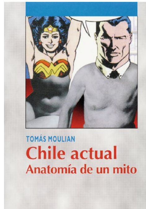
Couverture Chile actual, anatomía de un mito (Lom)